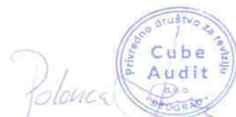
Polonca Đurić Licencirani ovlašćeni revizor