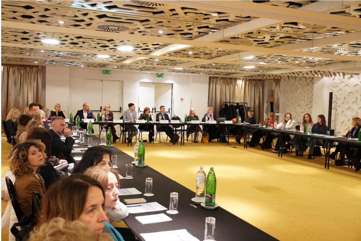
Слика 3. завршна конференција, представљање резултата истраживања.