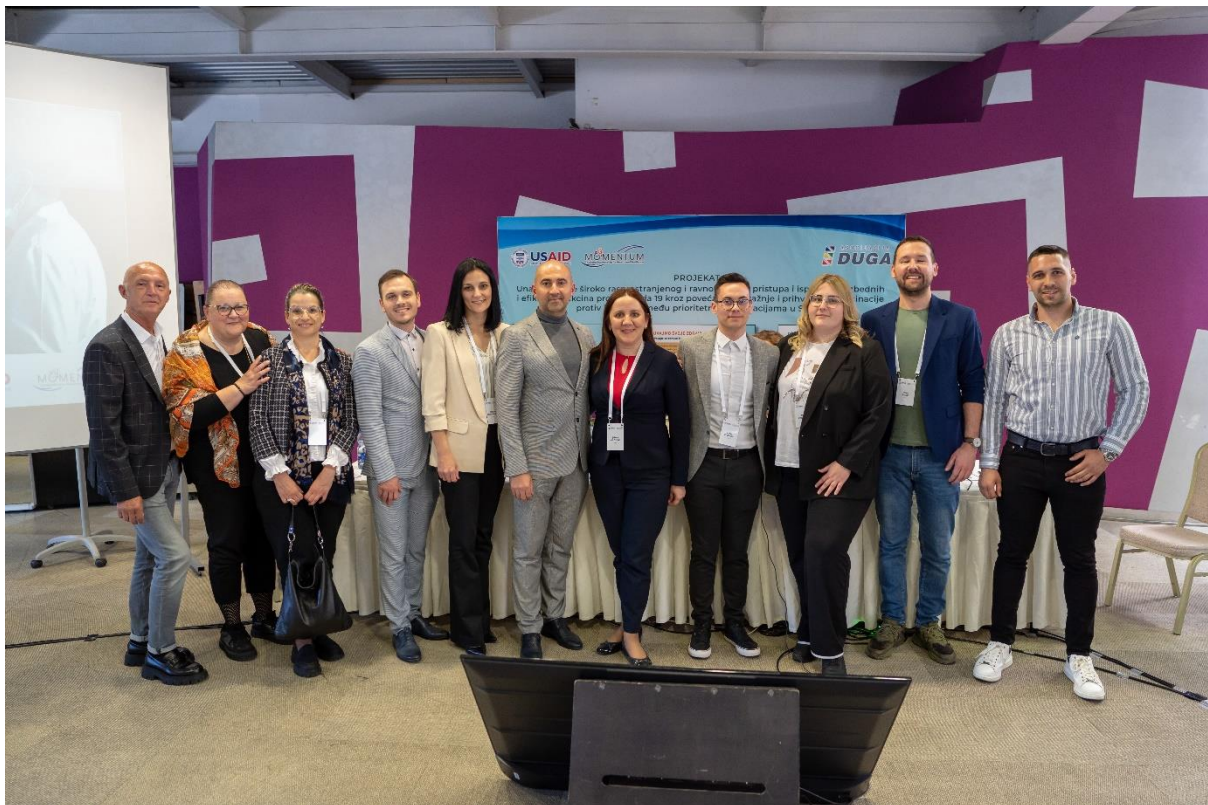
Слика 4. завршна МОМЕНТУМ конференција.