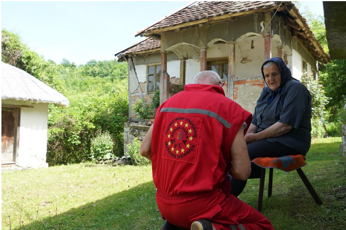
Слика 1. посета аутрич тима Асоцијације ДУГА корисници.