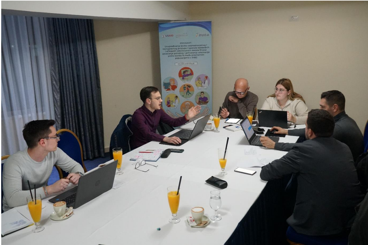
Слика 9. радни састанак тима Асоцијације ДУГА.