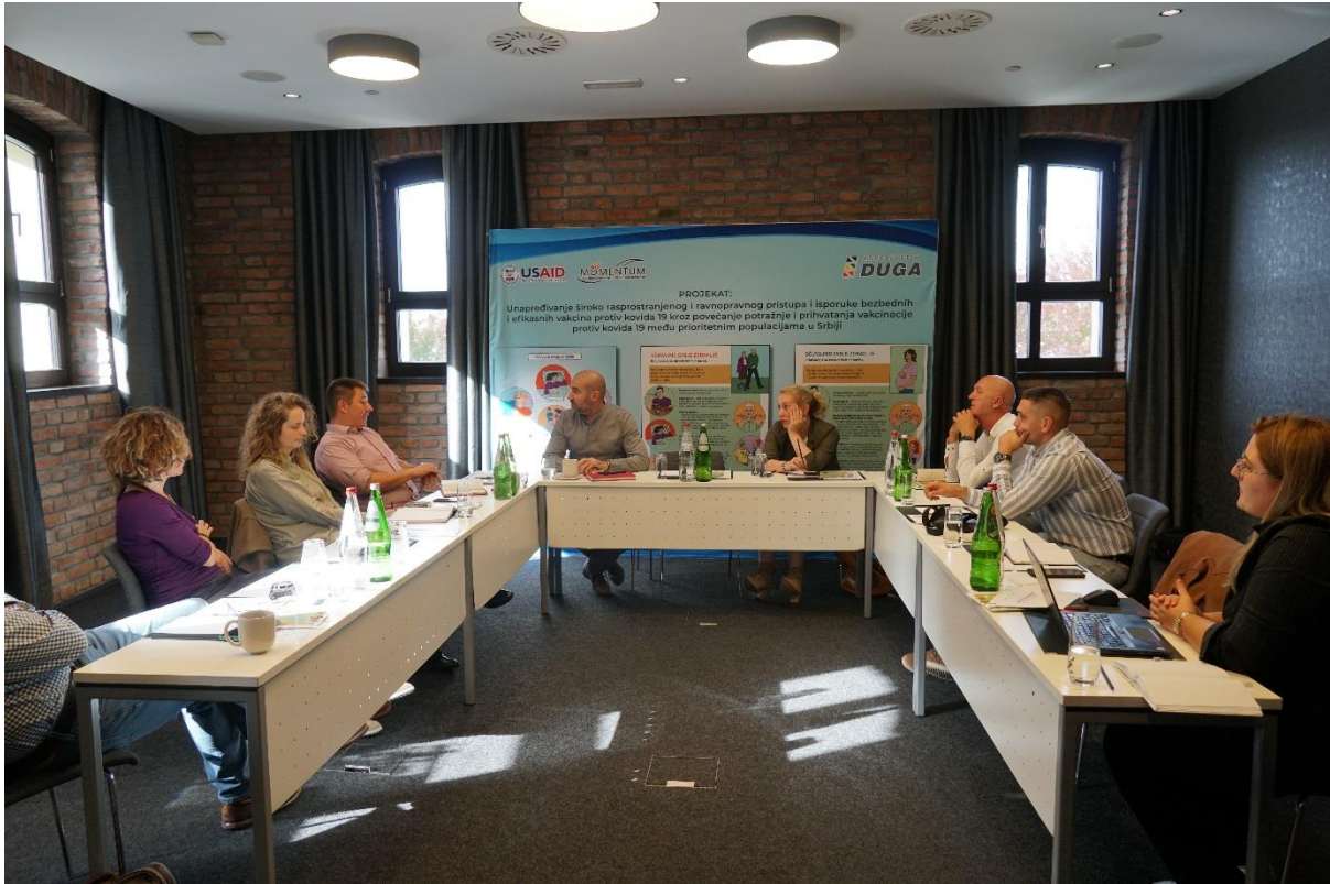
Слика 11. радни састанак тима Асоцијације ДУГА и консултаната.