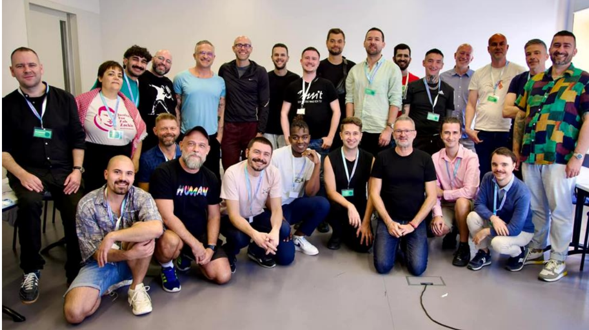
Слика 7. Интернационални састанак у организацији Aids Action Europe