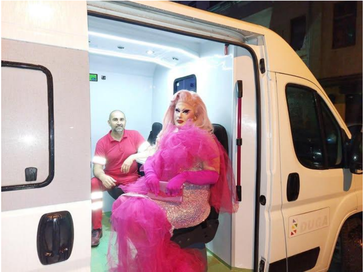
Слика 4. тестирање у мобилној јединици.