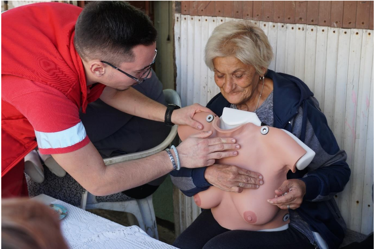
Слика 1. рад на терену Теренски сарадник едукује корисницу о самопрегледу дојке.