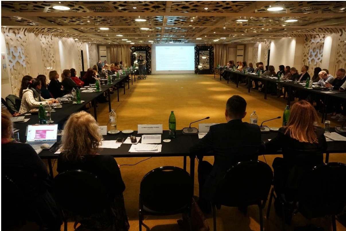
Слика 8. завршна конференција, представљање резултата истраживања.