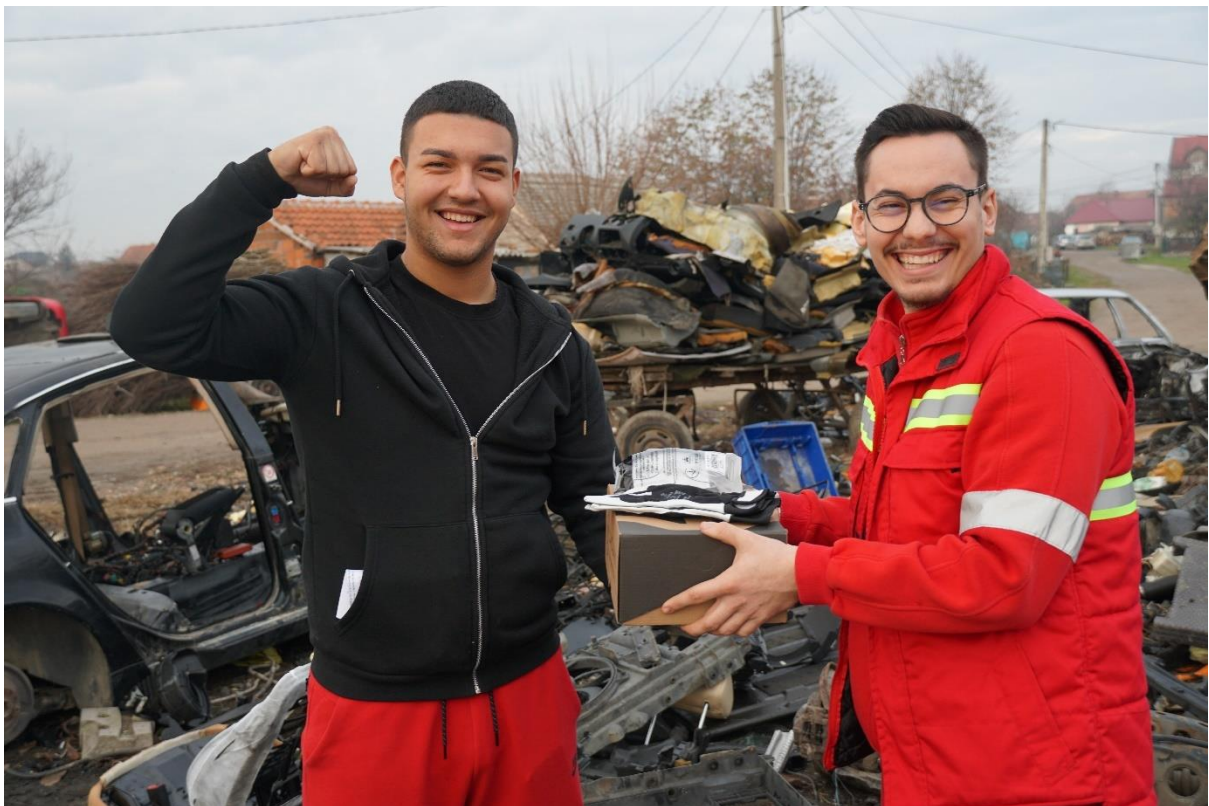
Слика 2. рад на терену Теренски сарадник у раду са сакупљачима секундарних сировина.