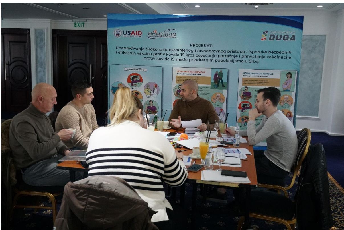
Слика 10. радни састанак тима Асоцијације ДУГА.